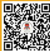
澳大本科升学网 微信号 UM_UGAdmission

有关硕士及博士学位课程入学查询，请浏览研究生院网页： https://grs.um.edu.mo/ 。