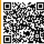
学费及住宿式书院费用